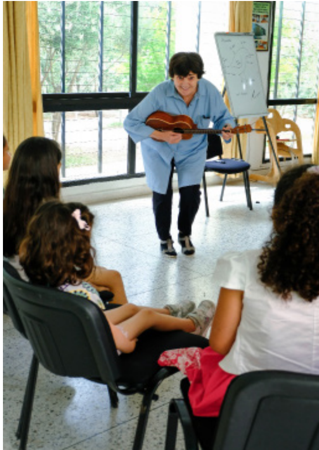
المنتوعة آن ويلسون سيمييدا