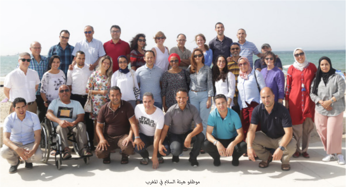
موظفو هيئة السلام في المغرب