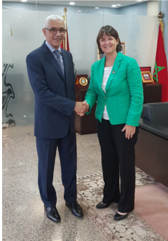
سوزان م. دواير مديرة هيئة السلام الأمريكية بالمغرب رفقة وزير الشباب والرياضة رشيد الطالبي العلمي

من جهتها، تساعد وزارة الداخلية إلى جانب الدرك الملكي وبشكل فعال هيئة السلام في الحفاظ على سلامة المتطوعين وتقديم الدعم اللازم على المستويين الوطني والمحلي. تعرب هيئة السلام المغرب عن امتنانها إزاء ما قدمه شركاؤنا وأصدقائنا من الحكومة المغربية من إرشادات وتشجيعات وما أبانوا عنه من روح الالتزام.