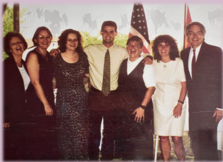
Група: МАК 1, 1996

Мировниот корпус ја формира својата програма во Северна Македонија во 1996 година, по покана од Владата на Северна Македонија. Оттогаш, повеќе од 800 волонтери имаат служено во училишта, општини, граѓански организации и јавни институции за да ги задоволат различните потреби на заедниците низ земјата. Како признание за значењето на Мировниот корпус за подобрувањето на македонско-американското пријателство и за ангажманот и посветеноста на волонтерите во македонското општество, претседателот на Македонија му додели Орден за заслуги на Мировниот корпус во 2011 година.