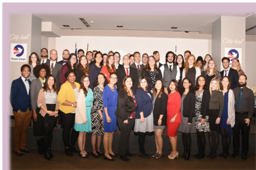
Група: МАК 23, 2018

Во текот на нивната служба во Северна Македонија, волонтерите се запознаваат со локалната култура, ги учат локалните јазици и активно учествуваат во општествениот живот. По пристигнувањето во Северна Македонија, волонтерите поминуваат низ интензивна обука за јазик, култура и технички вештини. За да се олесни нивната интеграција во локалните заедници, волонтерите живеат со локални семејства-домаќини за време на првичната обука, но и во периодот од 6 до 24 месеци од нивната служба. Мировниот корпус ја имплементира својата програма во Северна Македонија преку директна соработка со повеќе државни и локални партнери коишто се активни во сферата на образованието, развојот на заедницата, работа со младите и лицата со посебни потреби.