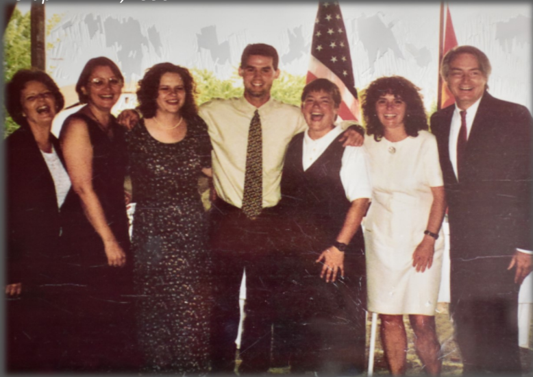
Grupi: MAK 1, 1996

Korpusi i Paqes formoi programin e tij në Maqedoninë e Veriut në vitin 1996, me ftesë të Qeverisë së Maqedonisë së Veriut. Që atëherë, më shumë se 800 vullnetarë kanë shërbyer në shkolla, komuna, organizata qytetare dhe institucione publike për të përmbushur nevojat e ndryshme të komuniteteve në vend. Si mirënjohje për rëndësinë e Korpusit të Paqes për përmirësimin e miqësisë maqedonase-amerikane dhe për detyrimin dhe përkushtimin e vullnetarëve në shoqërinë maqedonase, kryetari i Maqedonisë