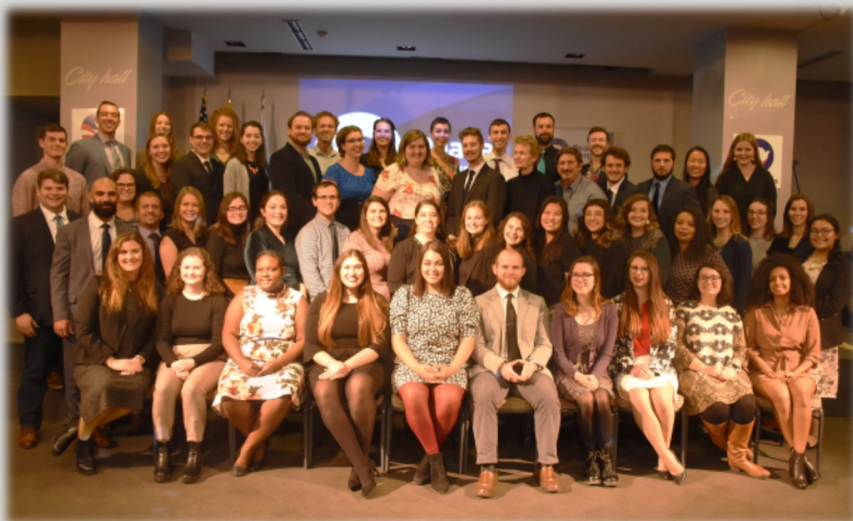
Grupi: MAK 24, 2019

Gjatë shërbimit të tyre në Maqedoni, vullnetarët njihen me kulturën lokale, mësojnë gjuhët lokale dhe në mënyrë aktive marrin pjesë në jetën shoqërore. Pas mbërritjes në Maqedoninë e Veriut, vullnetarët kalojnë nëpër një trajnim intenziv për gjuhën, kulturën dhe shkathtësitë teknike. Për të lehtësuar integrimin e tyre në komunitetet lokale, vullnetarët jetojnë me familje nikoqire lokale gjatë trajnimit fillestar, por edhe gjatë periudhës prej 6 deri 24 muaj të shërbimit të tyre. Korpusi i Paqes ka bërë implementimin e programit të tij në Maqedoninë e Veriut përmes bashkëpunimit direkt me disa partnerë shtetërore dhe lokal të cilët janë aktiv në sferën e arsimit, zhvillimin e komunitetit, punën me të rinjtë dhe personat me nevoja të veçanta.