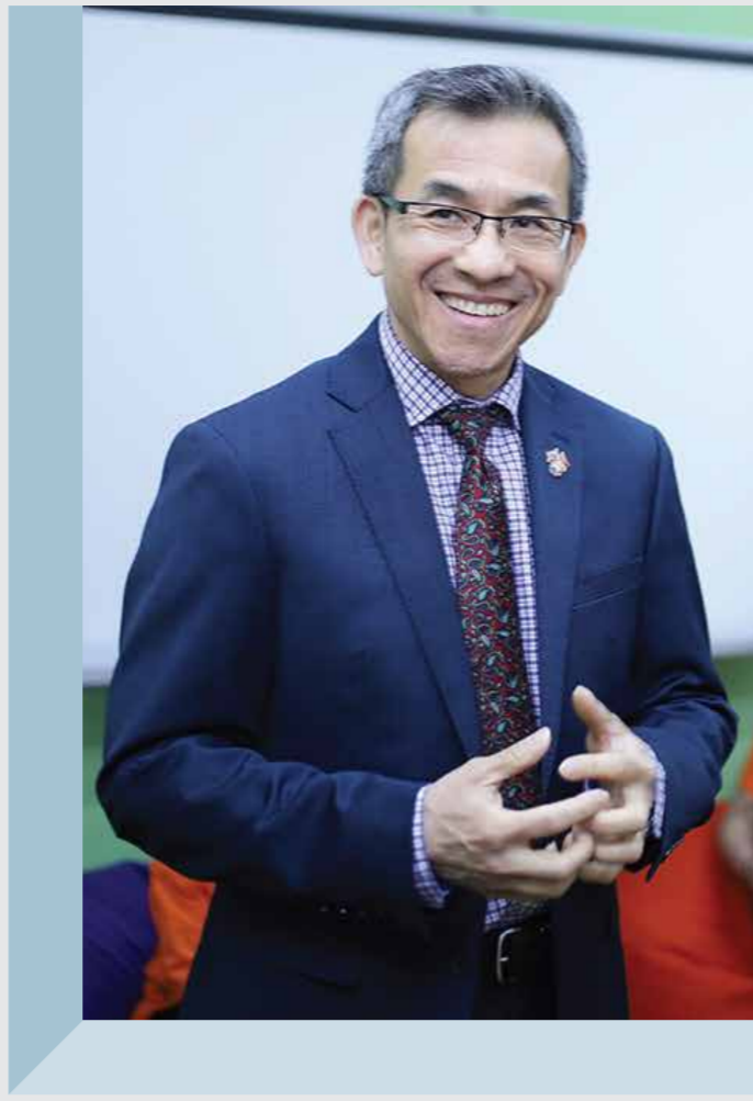
Սանի Լ.Լ. Խաղաղության կորպուսի հայաստանյան գրասենյակի տնօրեն

2019թ.-ին և գալիք տարիներին մենք հավատարիմ կմնանք հայ ժողովրդի և Հայաստանի կառավարության հետ աշխատելու մեր պատրաստակամությանը՝ շարունակելով մեր բարեկամությունն ու փոխըմբռնումն էլ ավելի ամրապնդելու նոր հնարավորություններ փնտրել: