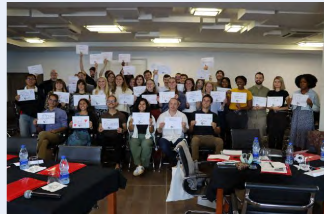
Volonteri i zaposleni pohađaju tekuće obuke, ali učestvuju i u aktivnostima dobiti tokom godine

Pored toga, tim održava snažna partnerstva sa lokalnim dobavljačima, pružaocima usluga i državnim institucijama. Tim za upravljanje i aktivnosti gradi temelj povjerenja i pouzdanosti. Iako se njihov rad često odvija iza kulisa, on je od ključnog značaja za misiju Mirovnog korpusa jer omogućava volonterima da efikasno i bezbjedno obavljaju službu u zajednicama širom Albanije i Crne Gore.