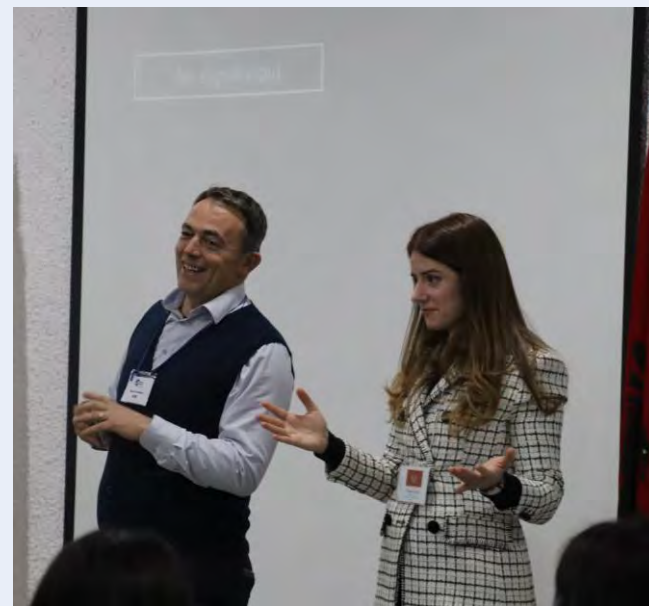
Tim za bezbjednost i sigurnost održava obuke za volontere.

Da bi se dodatno ojačala spremnost za reagovanje u kriznim situacijama, tim sprovodi obuke o bezbjednosti tokom dvogodišnjeg perioda službe, pripremajući naše volontere da adekvatno odgovore na vanredne situacije. Redovne procjene rizika, uključujući procjene smještaja tokom pripreme volonterskih lokacija, sprovode se radi smanjenja potencijalnih rizika. Pored toga, kada je potrebno, volonterima se upućuju preventivna bezbjednosna obavještenja kako bi se dodatno ojačala njihova svijest o situaciji i okruženju.