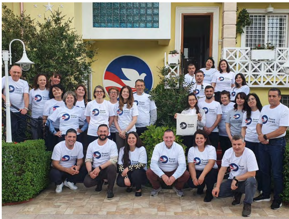
Zaposleni na događaju izgradnje timskog duha u 2025. godini.