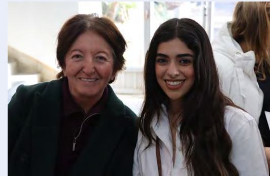
Volonterka sa majkom iz porodice domaćina

Zajednički obroci, učešće u porodičnim aktivnostima i neposredno upoznavanje sa tradicijama omogućavaju volonterima da dožive bogatstvo života u Albaniji i Crnoj Gori na način koji samostalan smještaj ne može u potpunosti pružiti. Ovi odnosi često prerastaju u trajna prijateljstva, dodatno potvrđujući misiju Mirovnog korpusa da promoviše međukulturalno razumijevanje.