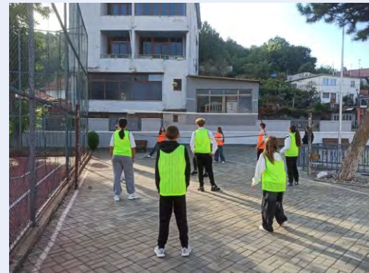
Ova saradnja oživjela je časove fizičkog vaspitanja i unijela novu energiju u cijelu zajednicu