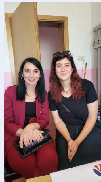
Nastavnice Ebigejl i Hike uspješno su sarađivale tokom 2025.