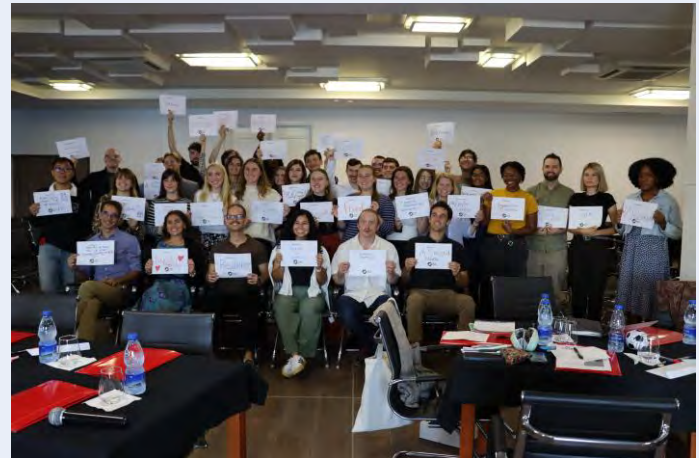
Gjatë vitit, stafi merr pjesë në trajnime të vazhdueshme, por edhe në aktivitete për mirëqenien.

Përtej këtyre, ekipi ruan partneritete të forta me furnitorë vendorë, ofruesit e shërbimeve dhe agjencitë qeveritare. Menaxhimi dhe operacionet janë themeli i besimit dhe besueshmërisë. Puna e tyre mund të kryhet në prapaskenë, por është e domosdoshme për misionin e Korpusit të Paqes - Dhënia e mundësisë Vullnetarëve që të shërbejnë në mënyrë të efektshme dhe të sigurt në Shqipëri dhe Malin e Zi.