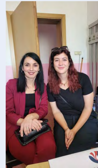
Mësueset Abigail dhe Hike bashkëpunuan me sukses në vitin 2025