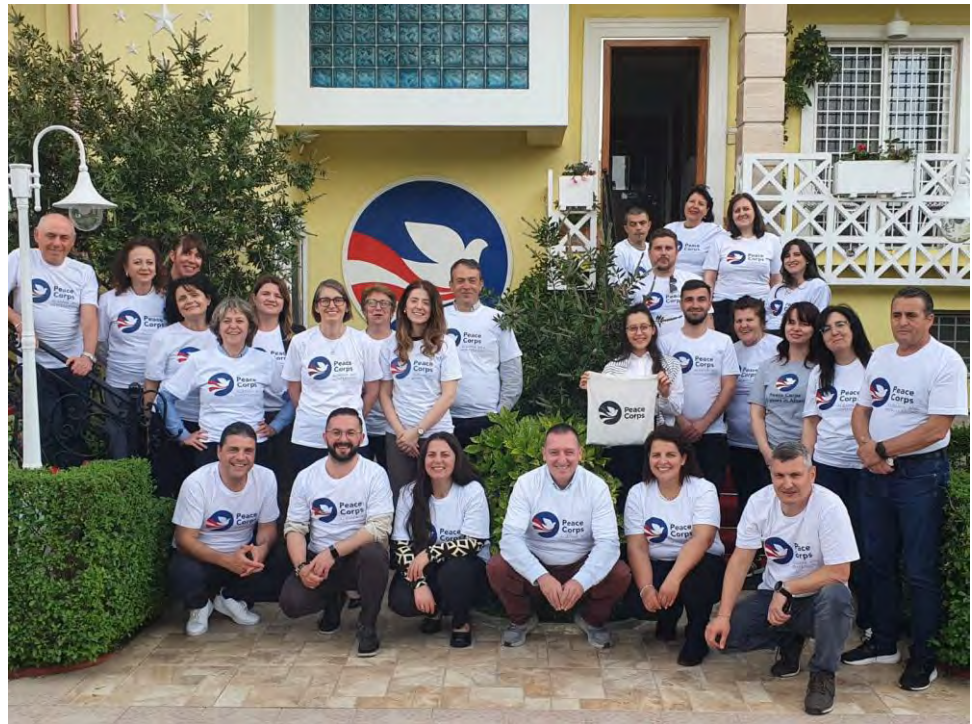
Anëtarët e stafit në një event për zhvillimin e ekipit në prill të vitit 2025