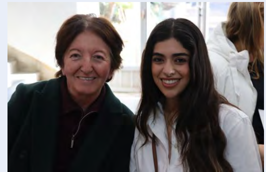
Një Vullnetar me nënën pritëse

ato janë udhërrëfyes kulturorë dhe burim mbështetjeje personale. Të ngrënit së bashku, pjesëmarrja në aktivitetet familjare dhe vëzhgimi i traditave drejtpërsëdrejti u mundëson Vullnetarëve të përjetojnë jetën e pasur në Shqipëri dhe Malin e Zi në mënyra që nuk do të mund t'i përjetonin nëse nuk do të jetonin me familjet. Nga këto marrëdhënie shpesh krijohen lidhje që zgjatin gjatë gjithë jetës, duke përforcuar misionin e Korpusit të Paqes për të nxitur të kuptuarit ndërkulturor.