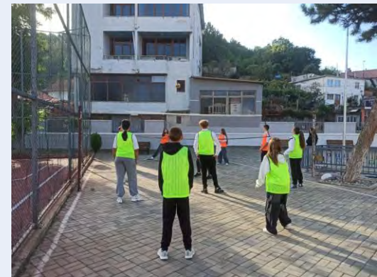
Ky bashkëpunim rigjallëroi orët e edukimit fizik dhe energjizoi të gjithë komunitetin.